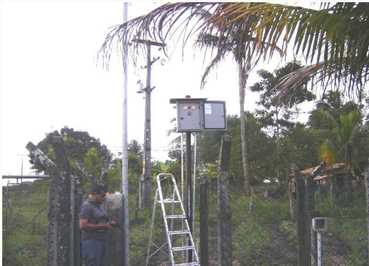
Figura 2: Último do Retificador desenvolvido para a SERGAS, instalado e operando desde 12/08/2009.