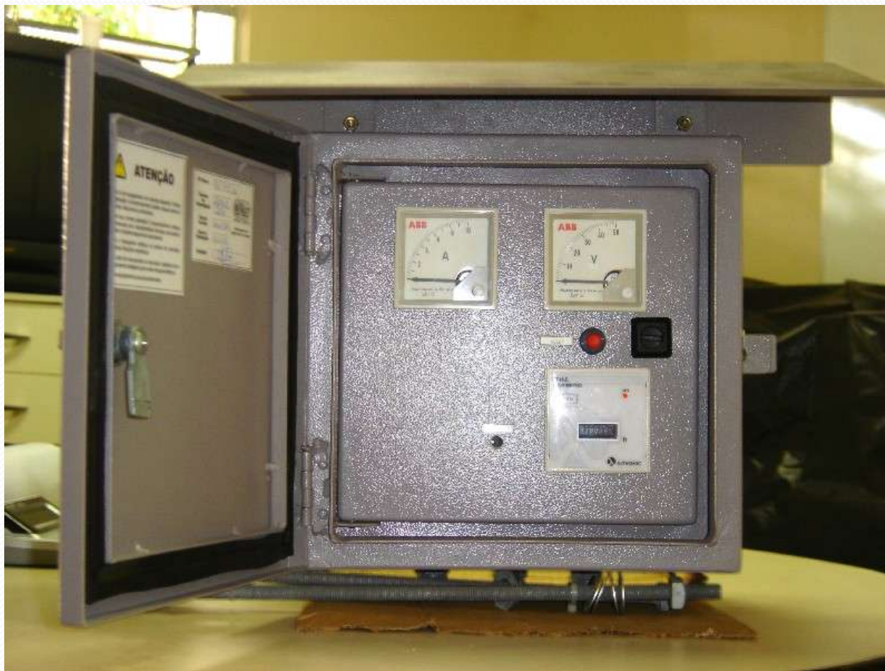
Figura 1: 1º Retificador desenvolvido para a SERGAS. Instalado e operando desde Janeiro de 2006.